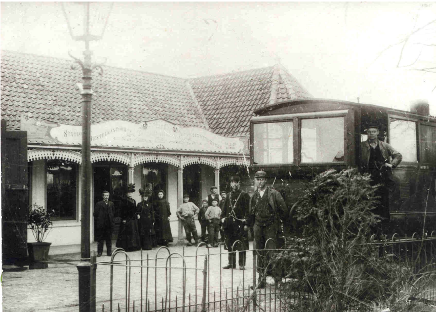
De tram met de conducteur en de bestuurder, hier voor een ander café: "Zomervreugd".

De conducteur stapte dan bij Tolhuis uit; liep naar Putje, vulde daar z'n kruiken en keerde terug naar de Straatweg om vervolgens bij Grietje de uit Alkmaar terugkerende tram af te wachten. Samen vervolgde het voltallige trampersoneel dan z'n weg naar Haarlem, alwaar na gedane arbeid het geneeskrachtige water in Hollandse munt werd omgezet. Maar deze keer probeerde de man met 'de heilige opdracht' het eens andersom: eerst naar het Tolhuis en daarna naar Putje.