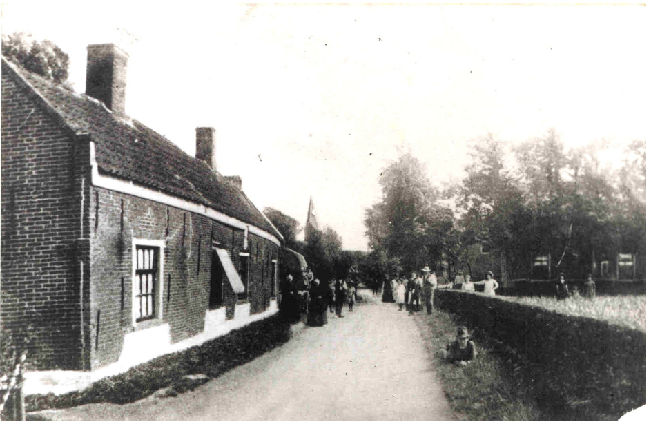
De Kamers even na 1900 vlak voor de oorlog zijn zij gesloopt.

"Wij ondergeschreevenen Denis Ad" Roest & Hieronymus Balthasar Roest Sedeeren & Transporteeren mits deesen aan de Roomsche Catholijke Gemeente tot Limmen de drie armen Kamers of Huijsjes gelegen bij desselfs Dorpe om door de Armen van die gemeente altoos bewoond te moeten worden. Geevende verdere de magt aan den Eerwaarden Heer W. Nooij, teegenswoordige Pastoor aldaar, en bij desselfs overlijden aan sijn Eerw. Wettige Opvolger om naar hunnen best gevallen en weetens de gemelde 3 Kamers of Huijses bij openvallinge te begeeven aan degeene van desselfs gemeente die dit best door hun gedrag verdienen en bij Geval dat God verhoede een of meer Inwoners derzelve tot den Drank of grove fauten neijgden, deese als dan tot de rust der anderen, terstont daar uijt te kunnen setten mits geensints den Intentie is Slegten, maar Vroome en deugdsame Menschen daarinne te laten Woonen. Verders om de Jaarlijkse penningen uijt de landerijen daar aan verschuldigt te kunnen ontfangen om uijt deselve de Jaarlijkse Reparationen den meergemelde armen Kamers of Huijsjes te Kennen doen &c** &c**, mits geevende jaarlijks reekenschap aan de Kerkmeesteren van Gemelde Gemeente dit alles tot meerder nut en voordeel der Armen tot Limmen. Amsterdam de 2* Majj 1777